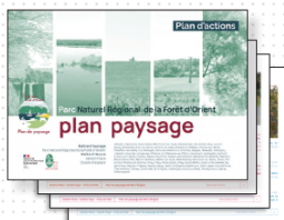
Le livrable papier

Rappel des documents de rendu de l'étude :